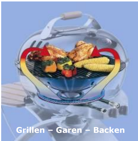
Grillen – Garen – Backen