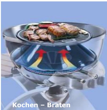
Kochen – Braten